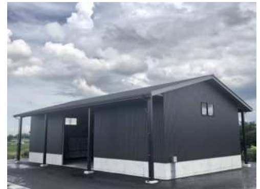
地域材を使用した木造倉庫