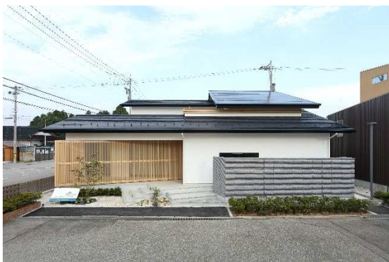
ジュートピア富山展示場