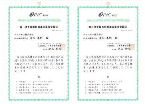
第一種、第二種登録木材関連事業者