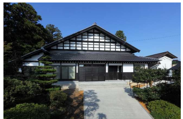
築150年の民家を大改修 古民家再生の家